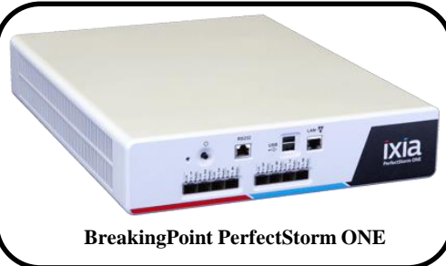
BreakingPoint PerfectStorm ONE

次世代の負荷試験装置には従来のL2~L7試験とセキュリティ攻撃との同時試験が必須です!