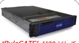
“RuleGATE” 1100 シリーズ

ベンダーによらない 数十億の最新IoC(Indicator of Compromise: 侵害の痕跡情報) をベースとした セキュリティインテリジェンスのリアルタイム自動運用化 を業界で初めて実現！